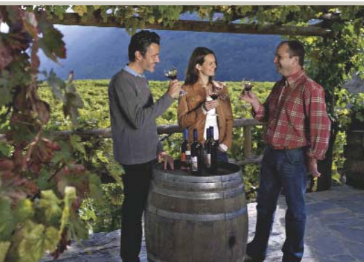
Degustation in Plan-Cerisier bei Martigny.

Wer einen Fendant auf den Tisch stellt, muss ein ehrlicher Mensch sein. Gestandene Menschen vertrauen sich im Gespräch, wenn sie sich mit dem Fendant zuprosten. Da ist kein Falsch, nicht in den Menschen und nicht im Wein. Am nächsten Morgen ist auch nach einem langen Abend