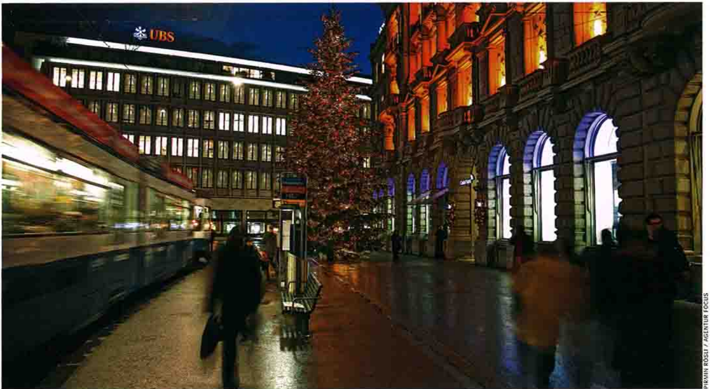
Bankenviertel in Zürich: Keine Steueroase, aber eine Insel des Wohlstands