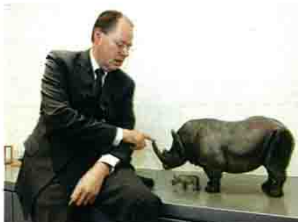
Deutscher Finanzminister Steinbrück „Er ist ein Nahkämpfer“