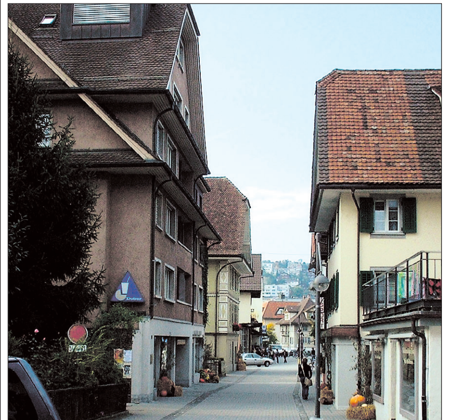
Den Klausjärgern wird eine Strasse gewidmet. Aus der Hürtelstrasse wird die Klausjärgasse.

auch in diesem Jahr wieder stattfinden würden. Plötzlich machte der anwesende Anton Kenel den Vorschlag: «Statt zu schimpfen würde man von Vorteil eine Gesellschaft gründen.» Die Idee erhielt positives Echo, wenige Tage später fand die Gründungsversammlung statt. Am Klausabend, dem 5. Dezember, wurden zwölf Infuln gezählt und insgesamt über 200 Klausjäger. In der Zwischenzeit ist der Umzug mit über 1300 aktiven Klausjärgern stark gewachsen. Der Vorstand ist auch heute für die geordnete Durchführung des Anlasses verantwortlich. Zusätzlich ist es Aufgabe und Pflicht der Gesellschaft, alljährlich Kinder, Betagte und Bedürftige von Küssnacht grosszügig zu beschenken. Bis heute gibt es keine Strasse in Küssnacht, die nach ihrem berühmtesten Kind getauft ist. Dies soll sich ändern. Die Hürtelstrasse wird noch vor der Generalversammlung, die am 28. November stattfindet, zur Klausjärgasse und der dort stehende Klausbrunnen soll in Kürze restauriert werden. Ob sich eine Änderung der Umzugsroute über die Poststrasse in die Klausjärgasse via Monséjour durchsetzt, wird sich an der Generalversammlung zeigen.